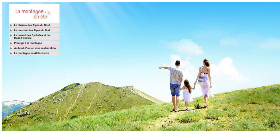
Figure 2. Montagne ressource

Image d'accueil de vente de séjours en montagne sur venteprivée.com. Les Alpes délocalisées (la montagne n'est plus un lieu mais un matériau-ressource) sont-elles dénaturées ? Aucun lieu n'est reconnaissable, le séjour se vend comme « montagne ».