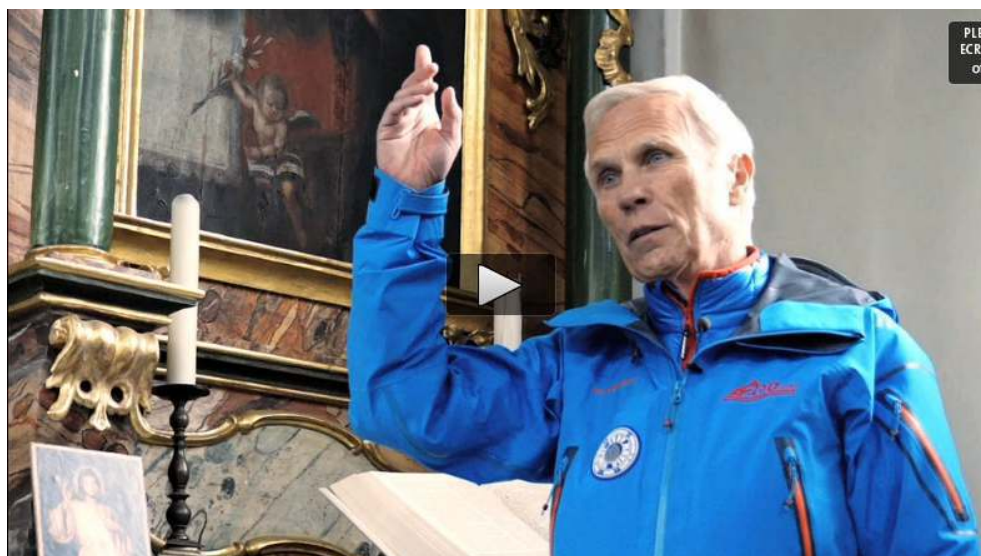
Figure 3. La ressource comme processus

« On a peut-être prié... un peu trop... Le glacier a commencé à reculer... »