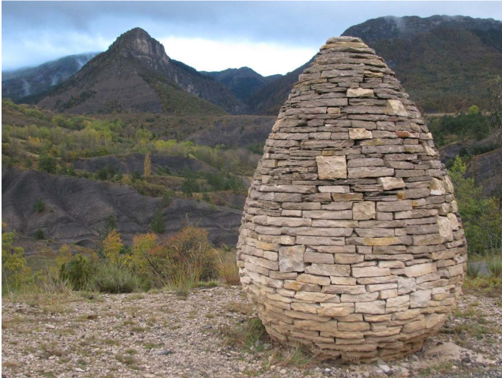
Photo 1. Sentinelle , vallée du Vançon (Authon), 2000. Sur le parcours Refuge d'art , par Andy Goldsworthy, haut-pays d'ignois.

« Je ne saurais pas expliquer pourquoi le cairn a une fonction de sentinelle. C'est une chose que je sais, tout simplement. Peut-être est-ce la façon dont il se tient, avec une énergie paisible et contenue. » (Andy Goldsworthy)